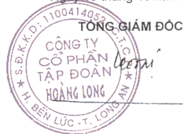
PHẠM PHÚC TOẠI